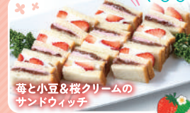
苺と小豆＆桜クリームの サンドウィッチ