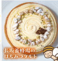
長坂養蜂場の はちみつタルト