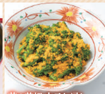
菜の花畑 辛子お浸し