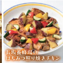
長坂養蜂場の はちみつ照り焼きチキン