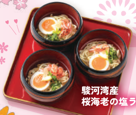
駿河湾産 桜海老の塩ラーメン