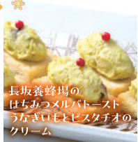
長坂養蜂場の はちみつメルバトースト うなぎいもとピスタチオの クリーム