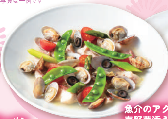
魚介のアクアパッツァ 春野菜添え