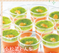
小松菜と人参 三日あかんのヘルシープリン