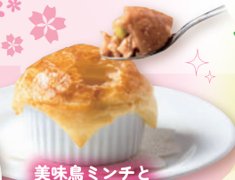
美味鳥ミンチと 浜松産じゃがいも 豆乳トマトクリームソースの パイ包み焼き