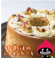
うなぎいもの シフォンケーキ