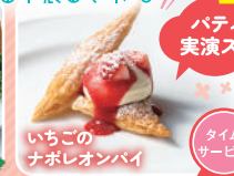
いちごの ナポレオンパイ